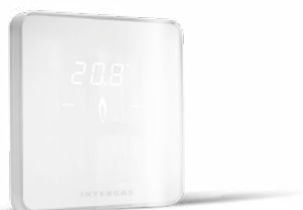
izbový Open Therm termostat Comfort Touch s drôtovou komunikáciou

Všetky varianty termostatov je možné v prípade potreby doplniť o vonkajší snímač pre ekvitermné riadenie kotla.