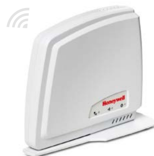
internetová brána pre prístup cez mobilnú aplikáciu